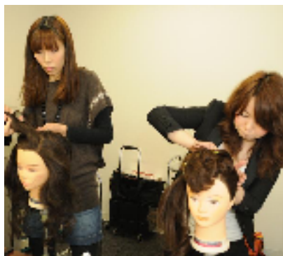
▲ ブライダル技術者育成研修の様子

美容業界で最も高い技術レベルが求められるブライダル。志願する美容師は後を絶ちません。トミーズ・スターは、ブライダル事業開始にあわせ“ブライダル技術者”の育成にも取り組んでまいります。ブライダル用メイクやヘア、ネイルなど高い完成度が求められる技術者の教育カリキュラムをアントワープブライダルと共同で開発。まずはトミーズ・スターの従業員を育成、次年度より育児や介護などを理由に第一線から退いている自社以外の美容師も対象とし、同技術者を輩出します。