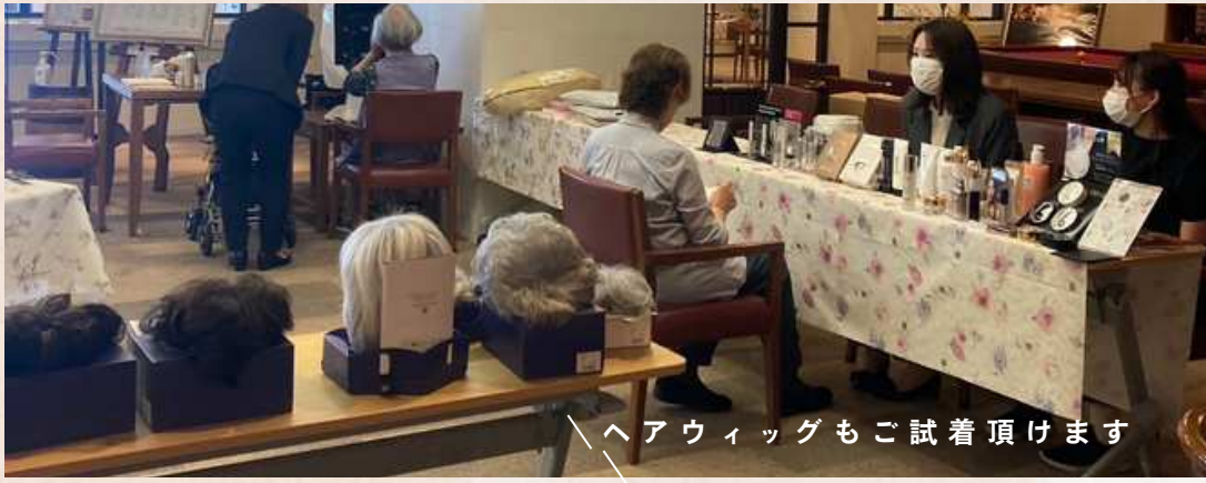
ヘアウィッグもご試着頂けます